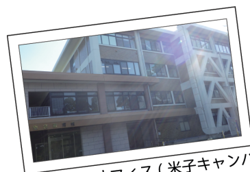
情報基盤機構米子オフィス(米子キャンパス内)