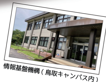
情報基盤機構(鳥取キャンパス内)